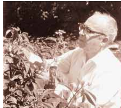
En esta foto de 1979 aparece en unos de sus viajes científicos a la Cordillera Central.