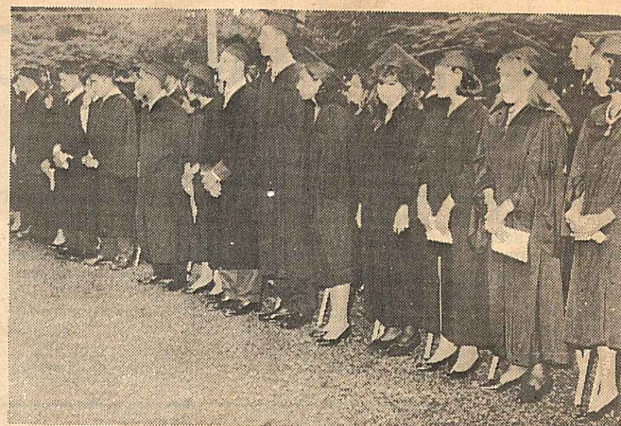
Parte de los graduandos que recibieron sus diplomas en la ceremonia que se realizó ayer en la tarde en el campus universitario de Santiago. En oportunidad 279 estudiantes fueron recibidos en diferentes áreas profesio-